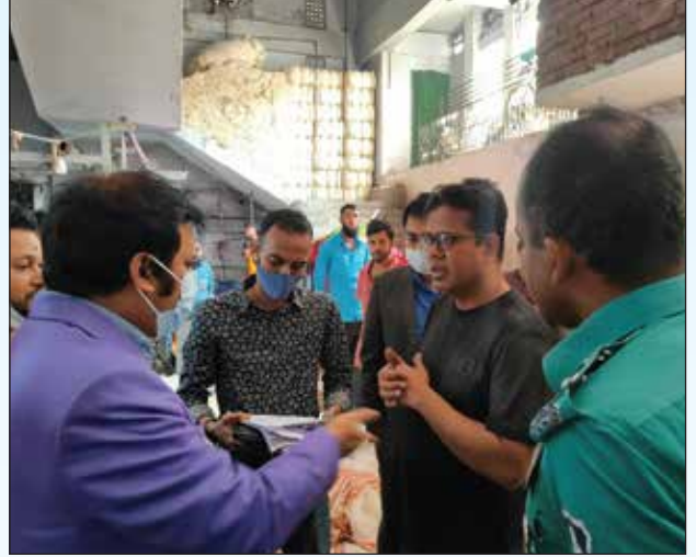
চিত্র: মার্চ/২০২৪ মাসে বিভিন্ন শিল্প কারখানায় মনিটরিং এন্ড এনফোর্সমেন্ট শাখা কর্তৃক বিভিন্ন শিল্প কারখানায় পরিদর্শন পূর্বক নমুনা সংগ্রহ

বাংলাদেশ পরিবেশ সংরক্ষণ আইন, ১৯৯৫-এর ৬৬, ১৫(১) ধারা অনুযায়ী জলাধার হিসাবে চিহ্নিত জায়গা ভরাট বা অন্য কোনোভাবে শ্রেণী পরিবর্তন করার অপরাধের ক্ষেত্রে অনধিক ২ (দুই) বৎসর কারাদণ্ড বা অনধিক ২ (দুই) লক্ষ টাকা অর্থদণ্ড বা উভয়দণ্ড।