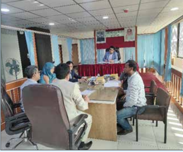
চিত্র: এনফোর্সমেন্ট শাখা কর্তৃক শুনানি গ্রহণ