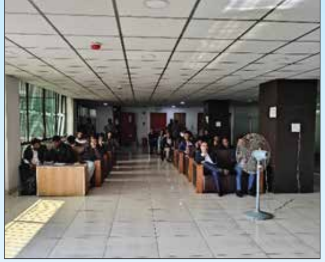
ছবি: এনফোর্সমেন্ট শাখায় শুনানীতে অংশগ্রহণকারীদের উপস্থিতি